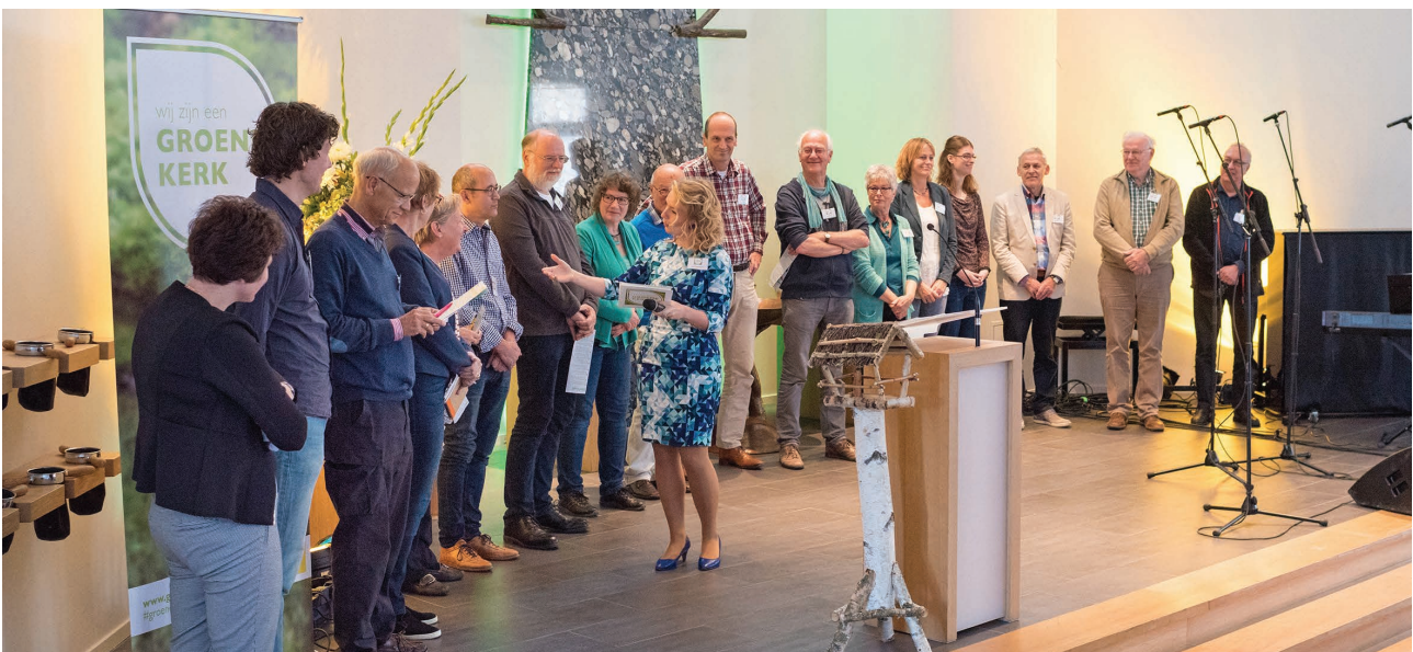
▲ De beweging GroeneKerken helpt lokale gemeenten bij de inzet voor duurzaamheid.

De kosten voor beheer en administratie zijn nagenoeg gelijk gebleven aan de begroting 2022. De toename ten opzichte van de voorgaande jaren is mede toe te schrijven aan een structurele stijging van IT-kosten als gevolg van optimalisatie van systemen en maatregelen in verband met cybersecurity. Op grond hiervan is de vastgestelde norm verhoogd naar 5-6%. In 6.5 geven we een toelichting hierop.