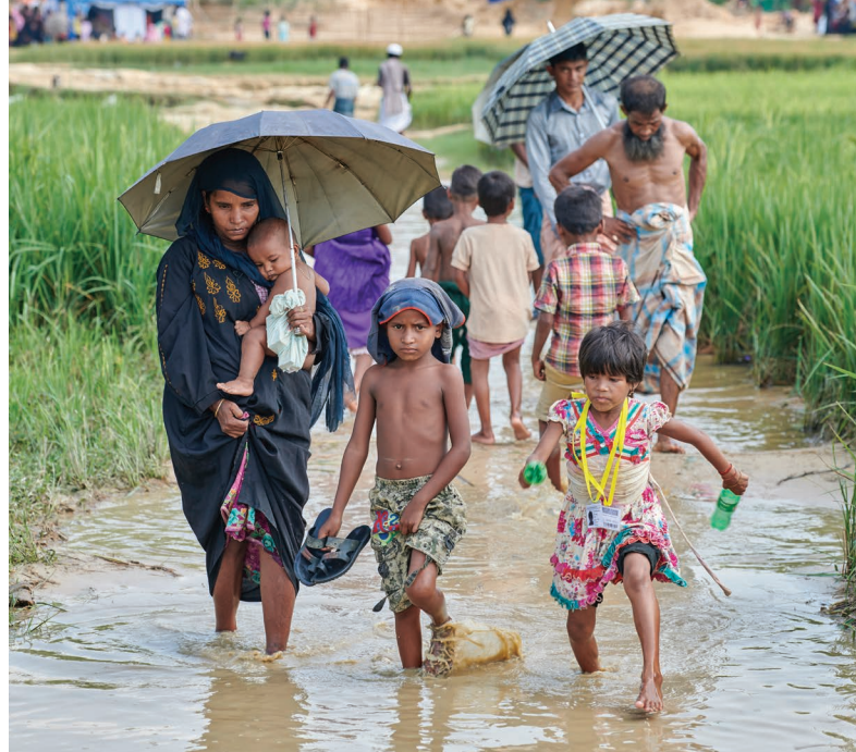
▲ Op zoek naar droge grond in Bangladesh.

Azië wordt steeds vaker geconfronteerd met natuurrampen en conflicten. Soms ligt de oorzaak