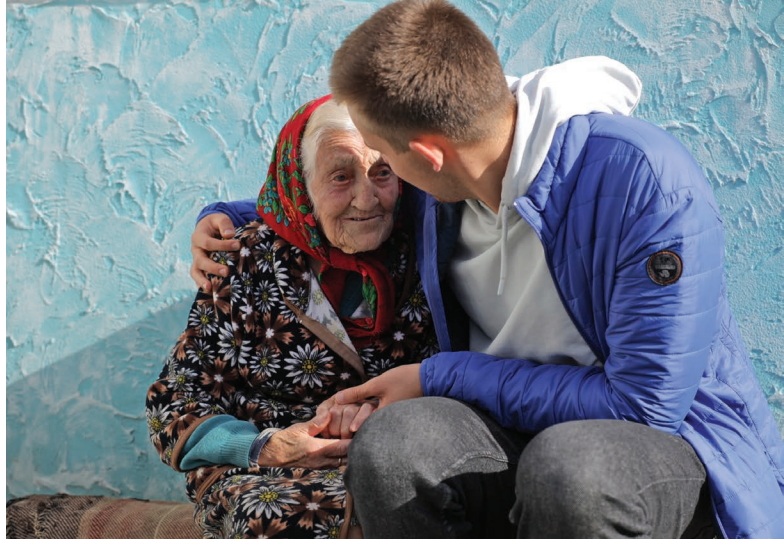
▲ Partners in Moldavië dragen bij aan de opvang van vluchtelingen.

In Egypte steunen we de orthodoxe en protestantse kerken met programma's voor gemeenschapsopbouw. Die zijn gericht op het bevorderen van de samenwerking tussen met name jonge christenen en moslims. De kerken hopen ook de emigratie van jonge christenen te verminderen door hen aan inkomen en vakbekwaamheid te helpen. In het land wonen bovendien veel vluchtelingen en arbeidsmigranten uit Afrika en het Midden-Oosten, soms met een christelijke achtergrond. Dit biedt kansen voor samenwerking rond het thema migratie. Het Shared Futures-programma speelt hierin een rol.