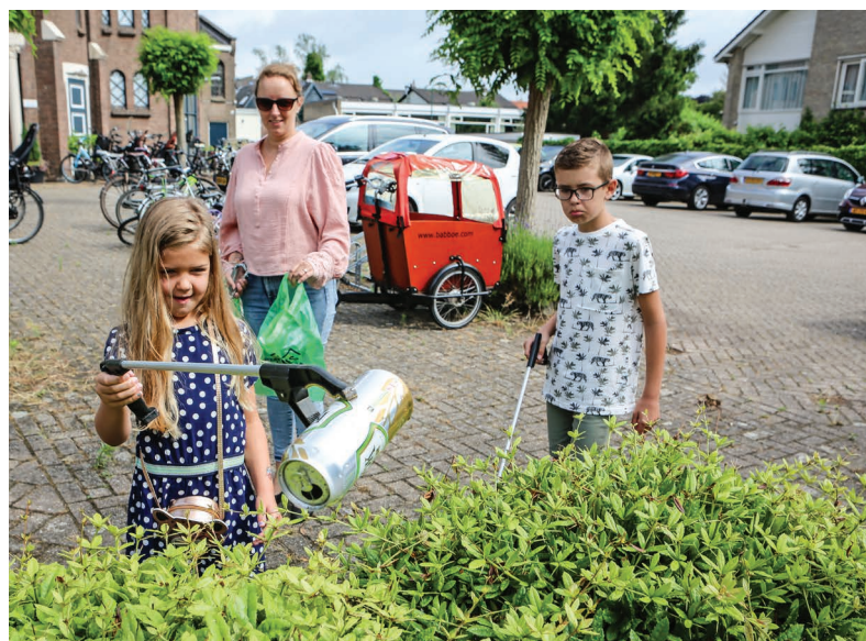
▲ Afval ruimen bij de Paaskerk in Baarn.

Kerk in Actie wijst jaarlijks de bedragen toe voor de steunverlening aan partners en projecten. Dat gebeurt op grond van de begroting die is vastgesteld door de kleine synode. De bestemmingsreserves kunnen gebruikt worden om in een volgend jaar eventuele tekorten te dekken als de inkomsten achterblijven bij de begroting. Zo voorkomen we dat een onverwachte daling van inkomsten leidt tot vermindering van steun die al aan partners toegezegd is.