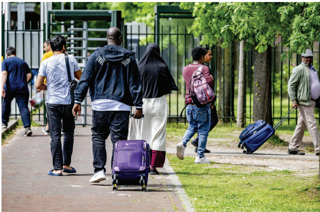
▲ In 2023 verbreden we het netwerk van lokale kerken die zich inzetten voor vluchtelingen.

Samen met lokale gemeenten geven we ook extra aandacht aan vluchtelingenkinderen. De verspreiding van de nieuwsbrief Vlugschrift Vluchtelingen gaat door in 2023. Er is ook specifieke aandacht voor ongedocumenteerden in Nederland en voor de positie van mensen die om hun geloof gevlucht zijn of niet terug kunnen naar het land van oorsprong (Commissie-Plaisier).