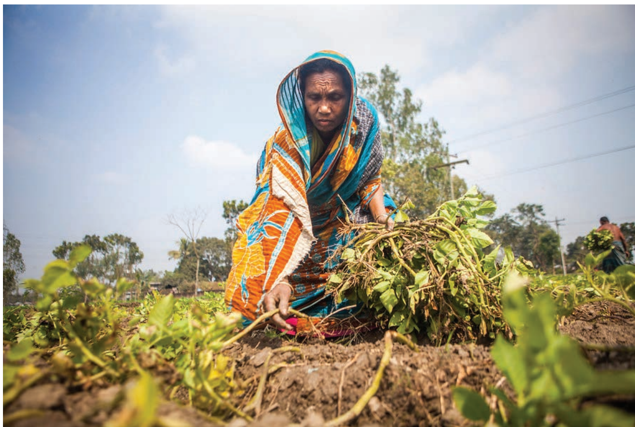
▲ Een boerin in Bangladesh verbouwt zouttolerante aardappels.

Voor ons werk in binnen- en buitenland moeten we voldoen aan de vereiste keurmerken. Kerk in Actie werkt actief aan het behalen en up-to-date houden van deze certificeringen. We zijn gericht op doorgaande kwaliteitsverbetering van werkwijzen en processen.