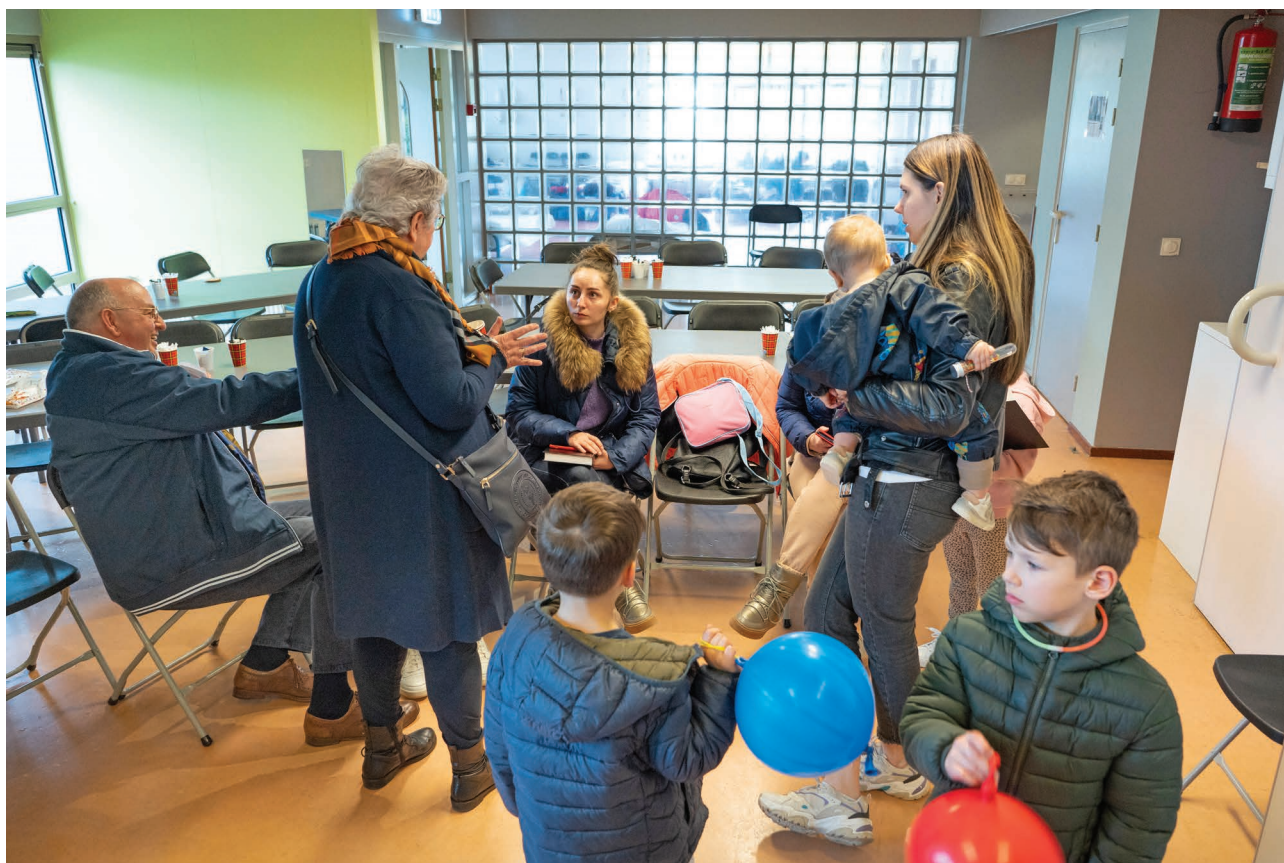
▲ Opvang van Oekraïense vluchtelingen door de Protestantse Gemeente Valburg.

Het resultaat 2023/2022 is conform het begrote resultaat in deze jaren. Op grond hiervan zal de verwachte stand van de bestemmingsreserves uitkomen op € 17,5 mln. De berekende norm komt in totaal uit op € 12,8 mln. Daarmee bedraagt de totale bestedingsruimte per saldo € 4,7 mln.