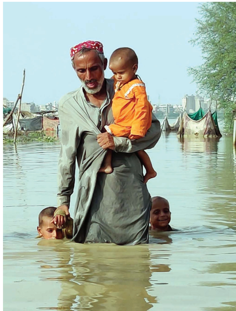
▲ Wereldwijd zijn miljoenen mensen op de vlucht door natuurrampen, hongersnood en oorlog.

Een heel concreet voorbeeld is het Nederlandse project De Thuisgevers. Dit hebben we opgezet na de beschamende humanitaire crisis in Ter Apel, in de zomer van 2022. Samen met lokale kerken geven we tijdelijk onderdak aan statushouders. In 2023 gaan we hiermee verder. In samenwerking met de landelijke en lokale overheid - maar onder protest vanwege het overheidsfalen - proberen we bij te dragen aan een oplossing voor de asielcrisis.