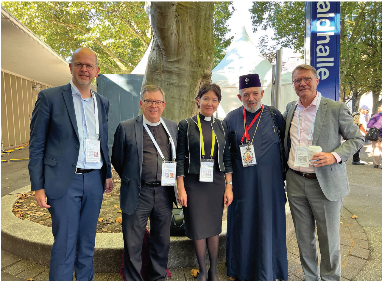
▲ Kerk in Actie is actief verbonden met de Wereldraad van Kerken.

Verder is Kerk in Actie lid van ACT (Action by Churches Together). Dit is de internationale koepel van kerken en christelijke organisaties verbonden met de Wereldraad van Kerken. Die samenwerking is belangrijk: samen kun je immers meer bereiken. Dat geldt zeker op het terrein van noodhulp, waar snelheid en slagkracht belangrijk zijn.